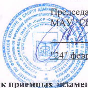
График приемных экзаменов для зачисления занимающихся в СШОР «Олимпиец» на учебно-тренировочные этапы спортивной подготовки по видам спорта на 2023 год